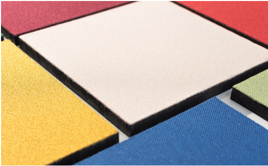
Kante Akustikvlies schwarz