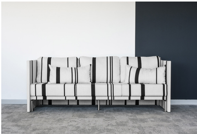
SP Stream 3-Sitzer H940 Ohne Steppung

Eine klare Formensprache und exzellenter Sitzkomfort, Silence Point Stream verbindet Funktion und modernes Design zu einer extra Portion Gemütlichkeit. Zuhause sind die einladenden Modelle u.a. auf offenen Büroflächen, in der Hotel Lounge sowie in Stores und Showrooms. Die in zwei Höhen mit 940 und 1100 mm erhältlichen Modelle schaffen komfortable Inseln zum Verweilen und Entspannen. Was dem Auge verborgen bleibt, der Wandaufbau ist im Kern höchst schallabsorbierend und trägt so zu einer guten Raumakustik bei. Erhältlich sind die Modelle als Ein-, Zwei- oder Dreisitzer. Zur Auswahl stehen für den Wandaufbau 9 Stoffkollektionen mit einer schier unbegrenzten Auswahl an Strukturen und Farben. So werden die Silence Point Modelle zum Lieblingsplatz mit Charakter und einem unverwechselbaren Erscheinungsbild. Sitzkomfort und ergonomische Ausstattung mit einladend weichem Rückenkissen sind ausgerichtet auf die Anforderungen im Projekt. Die liebevoll im Detail vollumpolsterten Wände, werden einseitig oder optional beidseitig auch in gesteppter Ausführung angeboten. Hierfür stehen 8 Stoffkollektionen mit unterschiedlichem Charakter zur Verfügung.