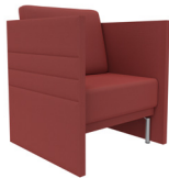
Einseitig außen gesteppt