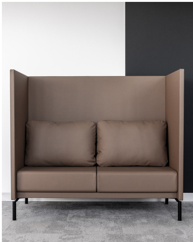
SP Concept 2-Sitzer H1400 Ohne Steppung

Geradlinig und schnörkellos im Design und mit einem ungemein bequemen Sitz- und Rückenpolster haben die Silence Point Modelle das Potenzial zum „Lieblingsplatz“. Ob auf der offenen Bürofläche, im Treppenhaus oder im Empfangsbereich die in drei Höhen, von 1100 mm über 1400 mm bis zu 1700 mm, erhältlichen Modelle schaffen Inseln der Ruhe und Entspannung. Was dem Auge verborgen bleibt, der Wandaufbau ist im Kern höchst schallabsorbierend und sorgt so für exzellenten Komfort. Erhältlich sind die Modelle als Ein-, Zwei- oder Dreisitzer. Zur Auswahl stehen für den Wandaufbau 9 Stoffkollektionen mit einer schier unbegrenzten Auswahl an Strukturen und Farben. Sitzkomfort und ergonomische Ausstattung mit einladend weichem Rückenissen sind ausgerichtet für die Anforderungen im Büroalltag und dessen Umfeld. Die liebevoll im Detail vollumpolsterten Wände werden ein- oder beidseitig auch in gesteppter Ausführung angeboten. Hierfür stehen 8 Stoffkollektionen mit unterschiedlichem Charakter zur Verfügung. Steppvarianten auf Anfrage.